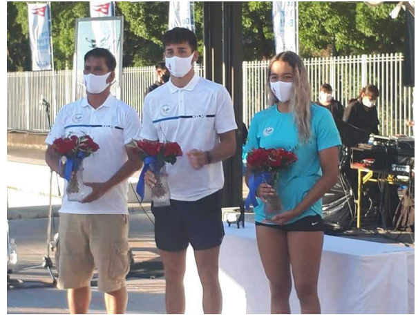
写真4 壮行会ではビクトリーブーケを進呈