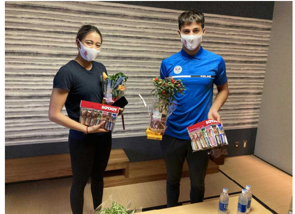
写真2 当協会からの差し入れ