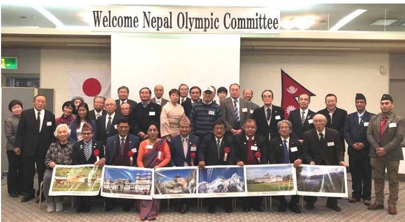
事前キャンプ実施協定締結記念歓迎会(2020・1・20)

ーホストタウン×JICA写真展ー 徳島から世界を知ろう ～カンボジア・ネパールを知ろう～ 東京2020オリンピック・パラリンピックの開催に向け、カンボジアとネパールに対する県民の皆様の理解を深めるために、スポーツ分野の国際協力活動を行っているJICAと連携し、ホストタウン登録のきっかけとなった徳島商業高校と徳島ネパール友好協会、そしてJICA海外協力隊の活動の写真を通して、カンボジアとネパールを紹介。 開催日時：令和2年12月18～27日 開催場所：ゆめタウン セントラルコート 主催：徳島県、JICA四国