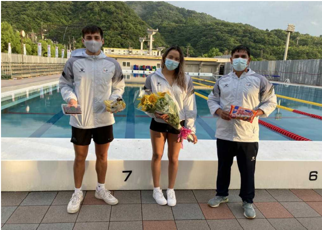
写真3 公開練習時にも差し入れ