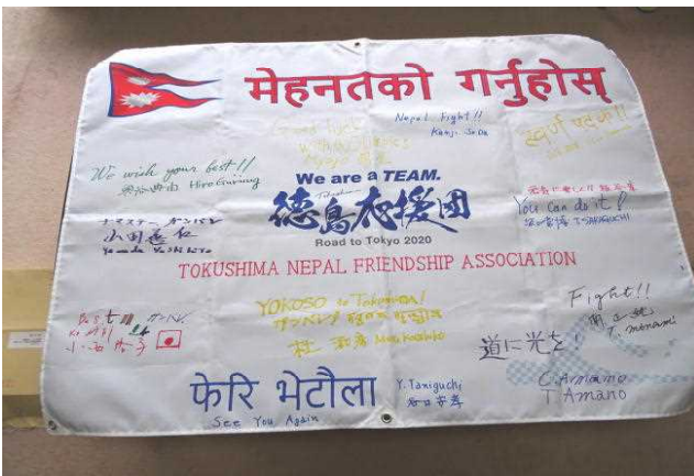
写真5 協会からの応援メッセージ