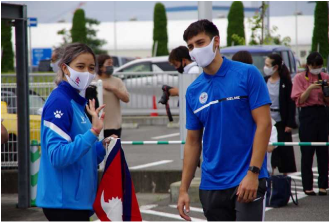
写真1 徳島空港前での歓迎式典