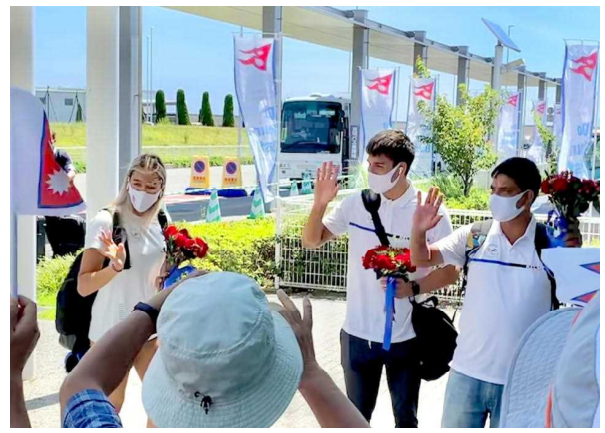
写真6 徳島空港でお見送り